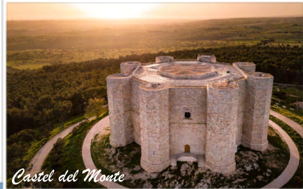
Castel del Monte